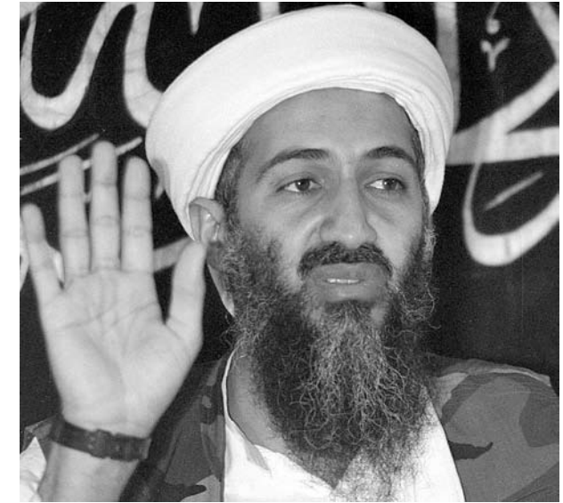
WTC-iskujen takana ei ole salaliitto, vaan Osama Bin Laden.

Osaman isän kuoltua hänelle oli jäänyt osuus perheen yrityksestä, jota siirtyi johtamaan yksi Osaman lukuisista veljistä. Osaman osuuden arvo potista oli noin 300 miljoonaa dollaria. Hän ei kuitenkaan saanut koko summaa heti käytettäväkseen, vaan