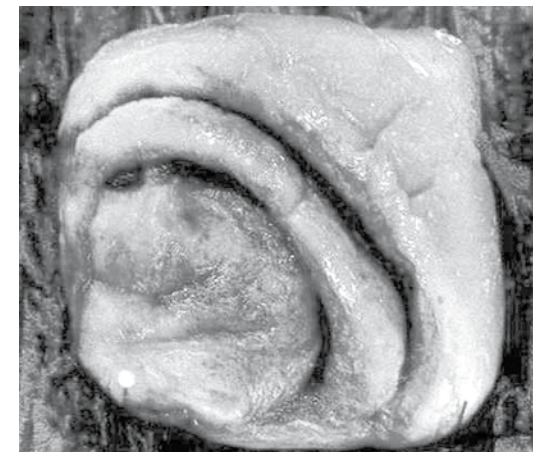
Korvapuustin päässä näyttää olevan äiti Teresan hahmo. Tästä pullasta tuli aikanaan maailmanlaajuinen uutinen.

Täyttä sattumaa on, että myös lehden seuraavan artikkelin WTC-savupatsaassa näkyy selvästi hymyilevä, turbaanipäinen mies.