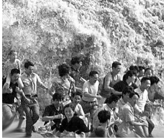
Kun ydintieto sekaantuu, tsunami voi merkitä Jumalan tahtoa yhdistää ihmisiä.

Cro Magnon -ihmiset elivät 30 000 - 50 000 eaa. Heidän aikanaan tapahtui "kulttuurin suuri pamaus": ilmestyi taide, uskonto, tek-