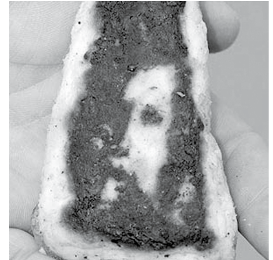
Jeesus ilmestyi kalapuikkoon. Näin tarkka kuva antaa jo aiheita epäillä, että kuva ei ole ilmestynyt kalapuikkoon sattumalta.

Useimmiten kyseessä on pareidolia, kuvien löytämisen taito, mutta melko usein takana on silkka huijaus.