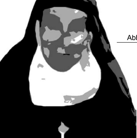
Abbedissalla oli asiaa.