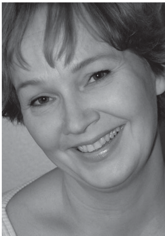
MARIA STARK / ATENAKUSTANNUS

Onneksi tajusin lopettaa homman ennen kuin menin liian pitkälle. On vaarallista ja edesvastuutonta, kun joku höttöä täynnä oleva tyyppi – kuten vaikkapa minä – saa yhtäkkiä mielettömästi valtaa